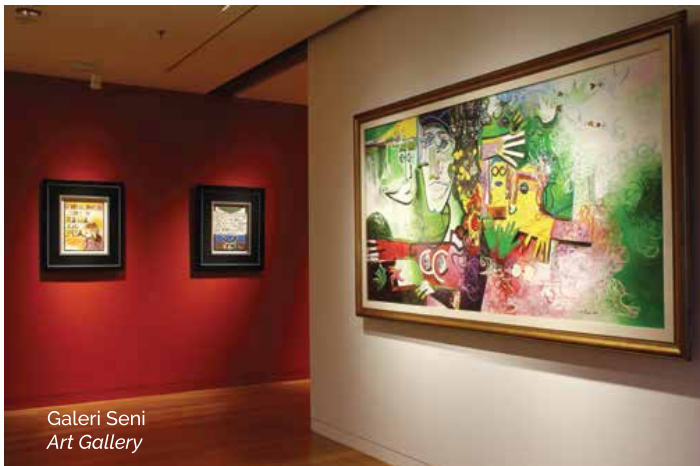
Galeri Seni Art Gallery