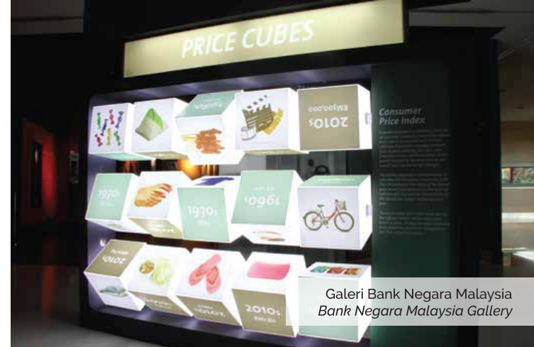
Galeri Bank Negara Malaysia Bank Negara Malaysia Gallery