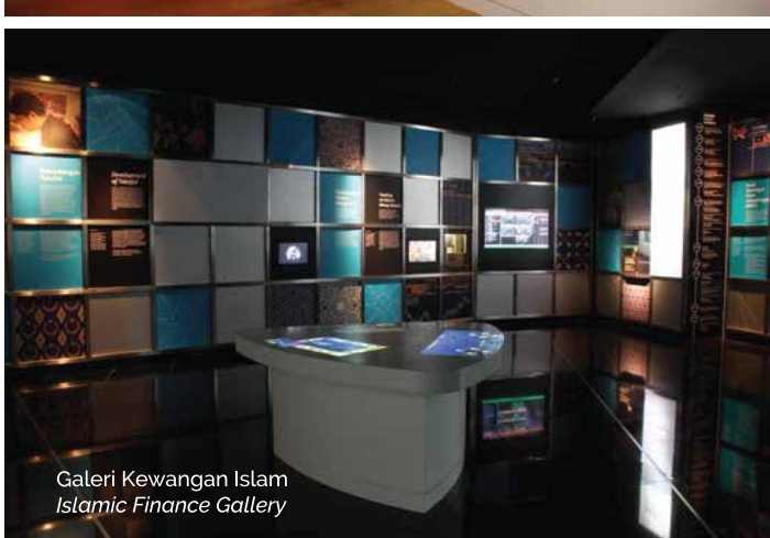
Galeri Kewangan Islam Islamic Finance Gallery