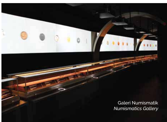
Galeri Numismatik Numismatics Gallery