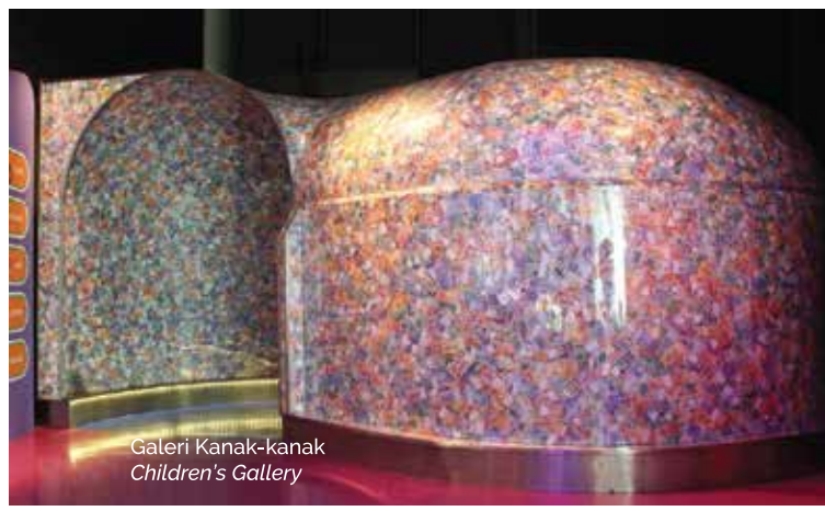
Galeri Kanak-kanak Children's Gallery